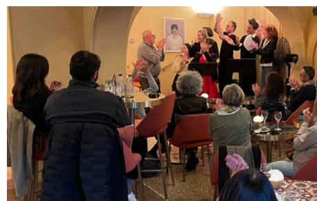
TNN © Théâtre national de Nice