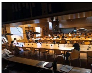
Archives d'Outre-mer