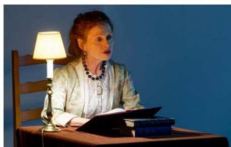
Hôtel de Sade, Isabelle Mentré