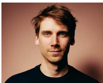
Rencontre Richardot