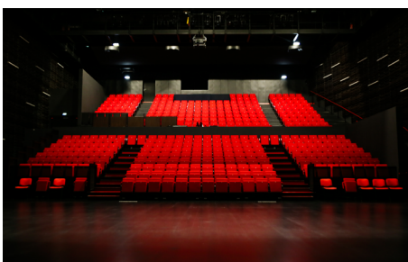
Théâtre de l'Arsenal

En Normandie , ce sont près de 400 événements qui sont organisés dans l'objectif de rassembler un public nombreux autour du plaisir de lire et du partage de la lecture.