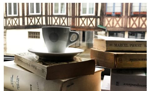
Hotel littéraire Flaubert