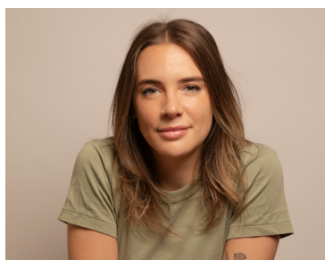
Lumir Lapray