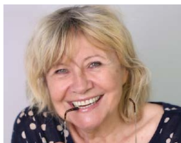
Annie Degroote