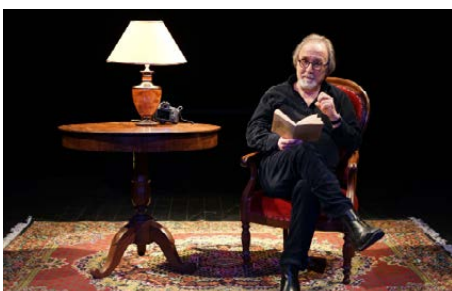
Chotteau dit Maupassant - Médiathèque Andrée-Chedid

Dans les Hauts-de-France , ce sont plus de 550 événements qui sont organisés dans l'objectif de rassembler un public nombreux autour du plaisir de lire et du partage de la lecture.