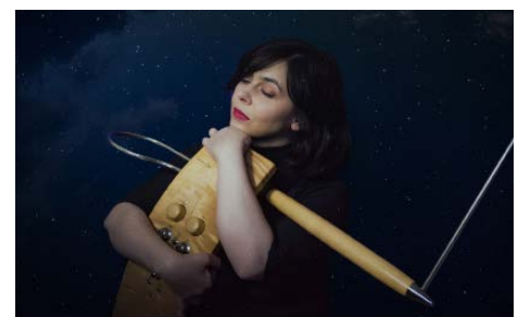
Rêverie O Theremine