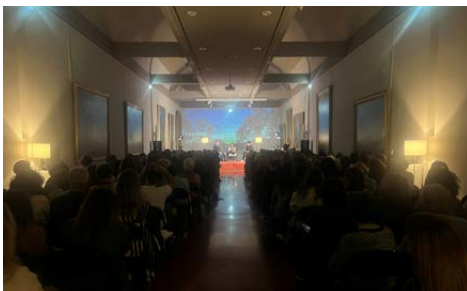
Palais Fesch – Salle du musée