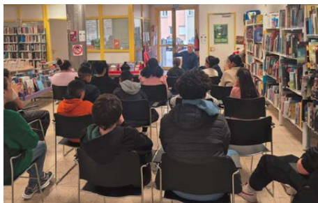
Médiathèque des Cannes – Franchi Auteur © DR