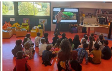
Médiathèque municipale de Ghisonaccia