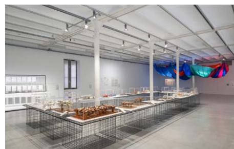
Exposition Des villes pour vivre