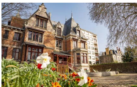
Bibliothèque gourmande Villa Rabelais

En Centre-Val-de-Loire , ce sont plus de 350 événements qui sont organisés dans l'objectif de rassembler un public nombreux autour du plaisir de lire et du partage de la lecture.