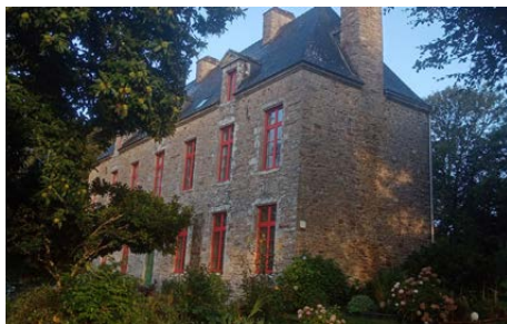
Abbaye de Lanveveaux

En Bretagne , ce sont plus de 400 événements qui sont organisés dans l'objectif de rassembler un public nombreux autour du plaisir de lire et du partage de la lecture.