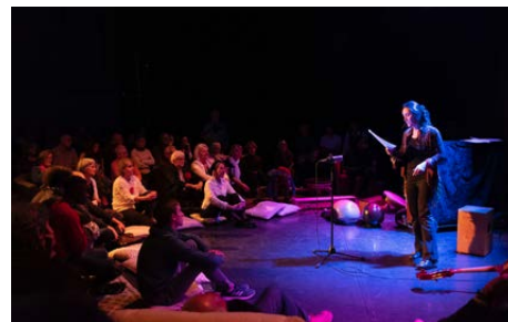
Passeurs d'histoires -airs du vent 2025