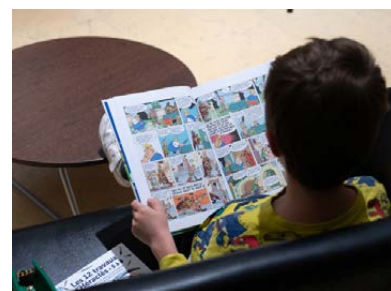
Bibliothèque éphémère au Lugdunum