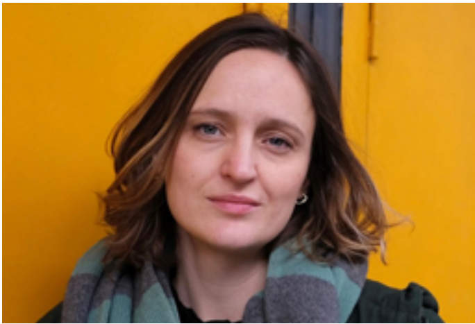
Puzzle - Hélène-Laurain

Vendredi 23 janvier de 18h à 22h, atelier de reliure, jeux de société, lectures à voix haute, jeux vidéo, rencontre « Résister en agriculture », visites de Tours (sur inscription ici ) 2 bis avenue André-Malraux 37000 Tours www.bm-tours.fr