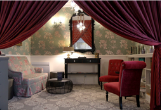
Hôtel Littéraire Flaubert

Samedi 24 janvier de 14h à 17h : mini-marché, à 18h30 et 19h30 : atelier fleurs séchées, sur inscription au 05 46 93 25 39, de 18h30 à 19h30 : quiz cinéophile, de 18h30 à 20h : histoire du rail à Saintes, de 18h30 à 20h30 : atelier BD, sur inscription au 05 46 93 25 39, de 18h30 à 20h30 : atelier aquarelle, sur inscription au 05 46 93 25 39, de 20h30 à 21h45 : spectacle « La Page blanche » par Emmanuel Zeppa et Guillaume Adnin Place d'Echevinage 17100 Saintes