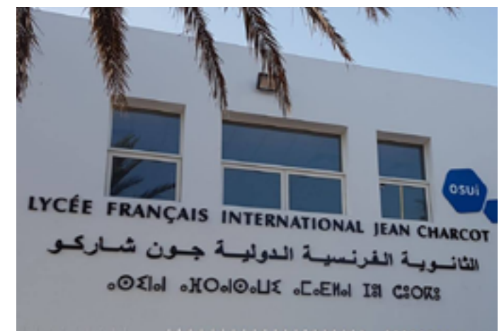
Lycée international Jean Charcot

Vendredi 23 janvier, réservé à un public scolaire BP 4911, Nouakchott