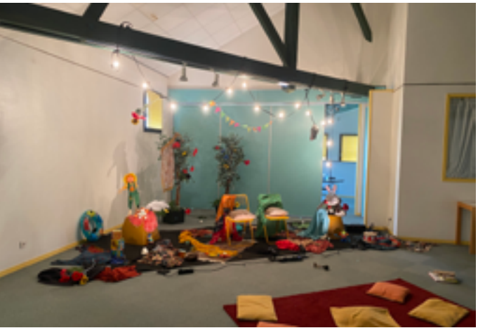
Médiathèque Jacques-Prévert © DR

Mercredi 21 janvier, lectures dans le noir à 18h, sur inscription ici La Soute - Jardin du Verney 73000 Chambéry Samedi 24 janvier, partage de coups de cœur à 10h, sur inscription ici Bibliothèque Georges-Brassens - 401 rue du Pré de l'Âne 73000 Chambéry www.lecturesplurielles.com