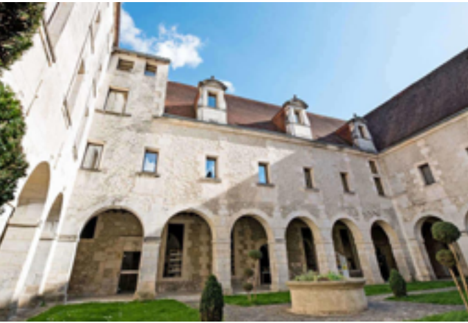
Médiathèque de Cognac

Du mercredi 21 au dimanche 25 janvier, fresque participative, construction collective en KAPLA® Mercredi 21 janvier de 15h à 17h : visites en réalité virtuelle, sur inscription au 05 55 20 21 48 Vendredi 23 janvier à 17h : annonce du palmarès du concours Minecraft®, sur inscription au 05 55 20 21 48 Samedi 24 janvier à 17h : rencontre avec Fabrice Varieras 16 avenue Winston Churchill 19000 Tulle