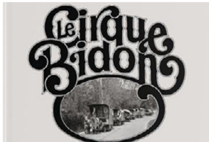
Le Cirque Bidon - Bernard Lesaing © Les édition de Juillet

La médiathèque Gaston Imbert accueillera une rencontre-dédicace autour du livre Le Cirque Bidon (rééd. Les Éditions de Juillet, 2021) du photoreporter et auteur Bernard Lesaing. Cette soirée proposera au