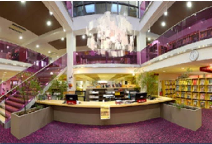
Médiathèque du Bassin d'Aurillac

L'association L'Envolée favorise la vie en collectivité, l'accès aux pratiques culturelles et la mixité sociale, culturelle et intergénérationnelle. Un goûter lecture à L'Envolée, organisé en partenariat avec l'école et la médiathèque de Boffres, proposera d'échanger les rôles : les parents s'installeront confortablement et se laisseront bercer par les histoires que les enfants leur feront découvrir. À la suite de ce moment chaleureux, une marche aux flambeaux mènera à la médiathèque, où de nouvelles lectures seront proposées autour d'une soupe. Le dimanche, un atelier inspiré de l'album jeunesse Le Jardin