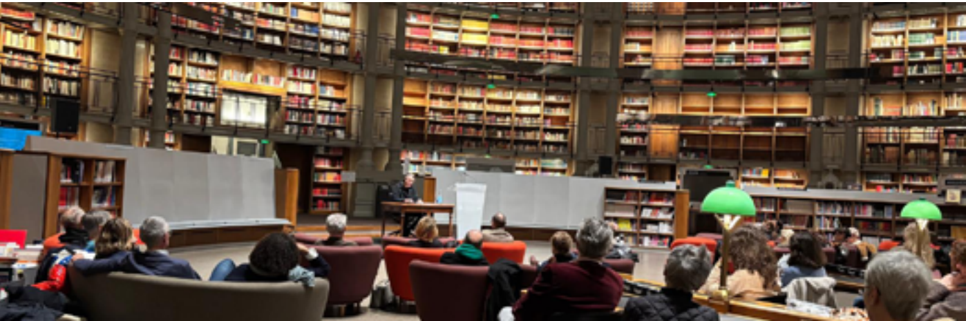
BnF - Salle Richelieu