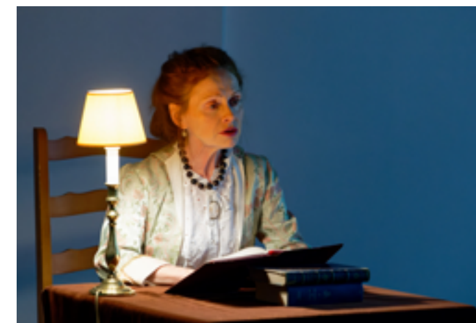
Hôtel de Sade - Isabelle Mentré