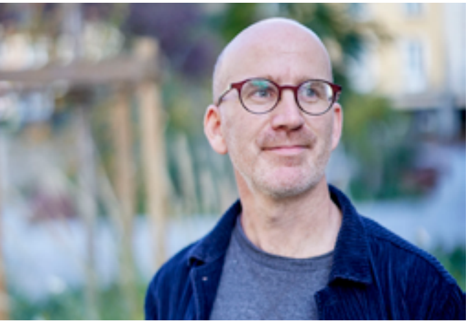
Régis Delanoë à la médiathèque de Carhaix

Jeudi 22 janvier à 19h15, sur inscription ici 263 avenue du Général-Leclerc 35042 Rennes www.bibliotheques.univ-rennes.fr/bu-beaulieu