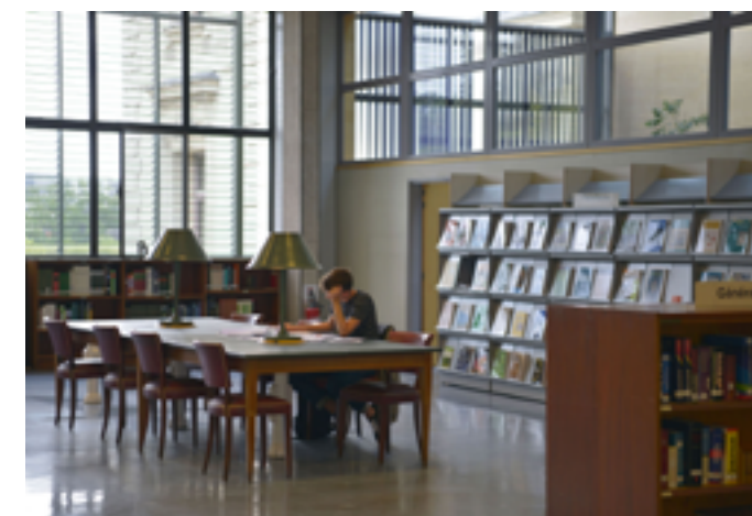
Bibliothèque centrale du Muséum national d'Histoire naturelle

Mercredi 21 janvier à 10h : atelier de construction jeune public Samedi 24 janvier à 14h : balade littéraire 3 rue de la Ribère 65100 Aspin-en-Lavedan