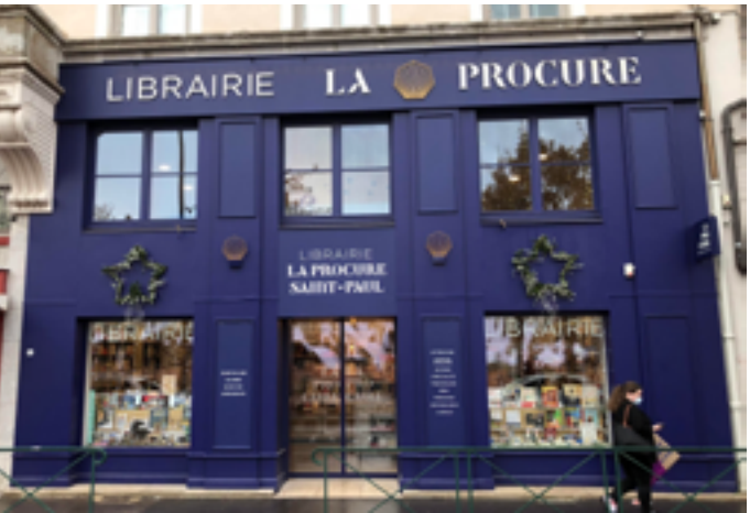
Librairie La Procure © Lyon

Jeudi 22 janvier à 19h, sur inscription à bferrari@laprocure.com 8 place Bellecour 69002 Lyon www.laprocure.com