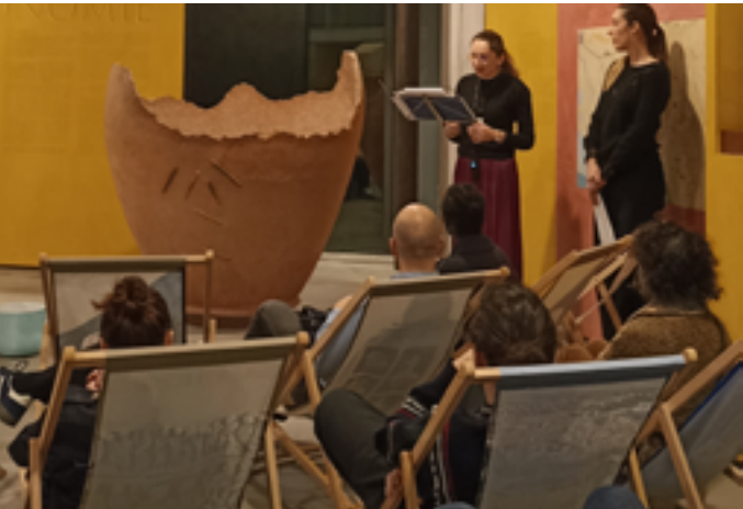
Musée départemental Arles antique

Vendredi 23 et samedi 24 janvier à 18h15, sur inscription au 04 13 31 51 03 ou ici Presqu'île du Cirque Romain 13200 Arles www.arlesantique.fr