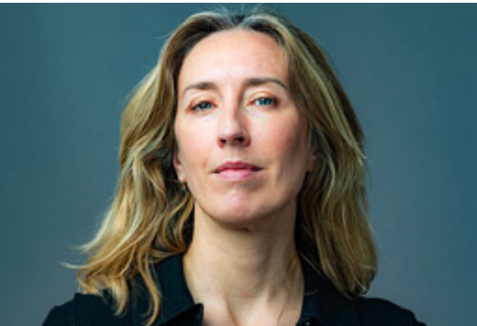
Émilie Guillaumin © DR

La Bibliothèque Sonore d'Évreux et ses Donneurs de Voix rendront visite au collège de Navarre, où ils mettront à disposition des élèves en situation de handicap des livres audio adaptés. Ils offriront également des lectures sur le thème « Villes