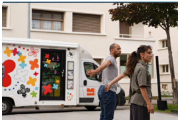
Mediatheques de Villeurbanne © Compagnie du Subterfuge