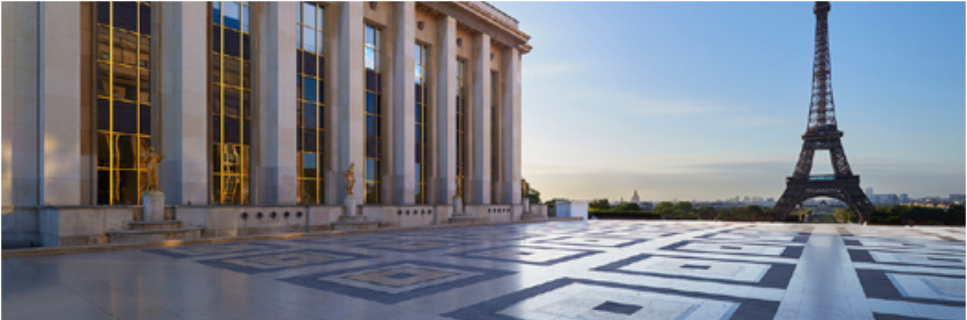
Cité de l'architecture et du patrimoine

Samedi 24 et 25 dimanche janvier, « Les Règles du jeu » et « La Mare à sorcières » à 14h et à 18h30 (uniquement le samedi), « 4x4 F.A.I.L. » à 17h et « Mathieu au milieu » à 15h30 Sur inscription ici 17 avenue du Général Eisenhower 75008 Paris www.grandpalais.fr