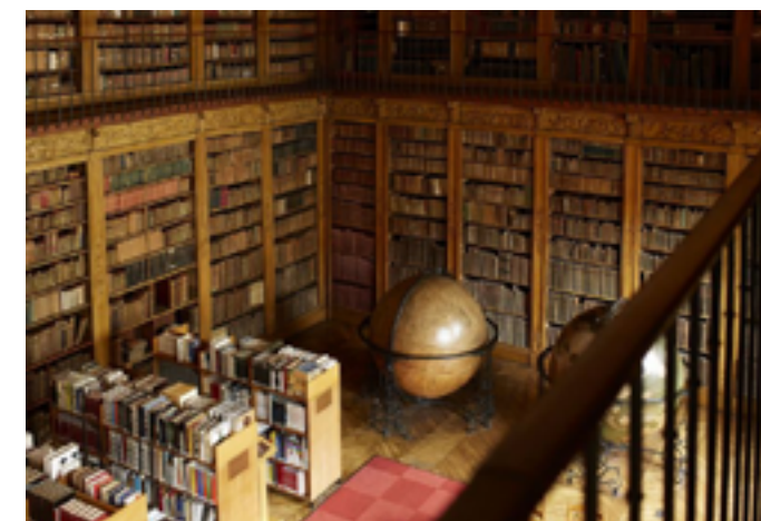
Bibliothèque de Chalon-sur-Saône © DR