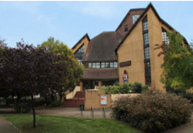
Bibliothèque Jacques-Lacarrière

Samedi 24 janvier de 14h à 18h, réservé aux publics internes à la structure 24 cour du Général Eisenhower 51100 Reims