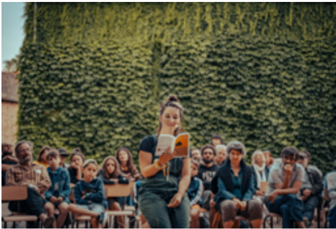
Lecture théâtralisée de Ruralités

Au Ciel (rooftop), 2 rue Général Marchand 38000 Grenoble