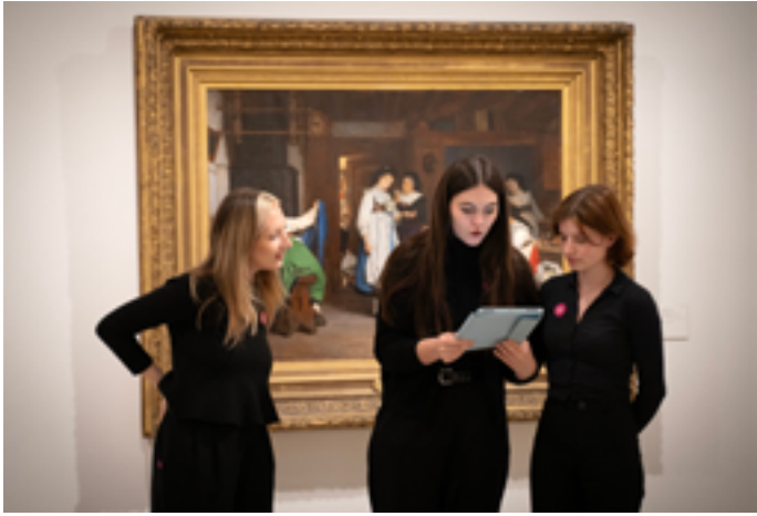
Déambulations littéraires

Vendredi 23 janvier à 19h et 20h30 : déambulation artistique et littéraire Dimanche 25 janvier à 11h : visite-écriture (payant), à 14h : atelier famille (payant), sur inscription au 03 89 20 22 79 ou ici Place des Unterlinden 68000 Colmar www.musee-unterlinden.com