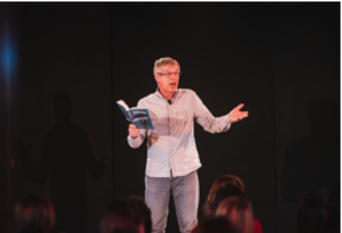
Bibliothèque Robert-Desnos - Jean-Claude Mourlevat

Mercredi 21 janvier de 14h à 16h et de 18h à 20h : atelier découverte de la machine à coudre, de 18h à 20h atelier découverte de l’imprimante 3D. Ateliers sur inscription au 02 31 24 25 93 4 rue de la Mairie 14810 Gonneville-en-Auge www.epn.ncpa.fr