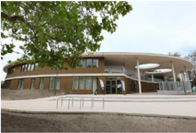
Maison de quartier de l'Alliance

Vendredi 23 janvier de 19h30 à 22h30, sur inscription au 06 38 50 36 07 ou ici 1 bis rue Branville 14000 Caen www.aventuraclub.over-blog.com