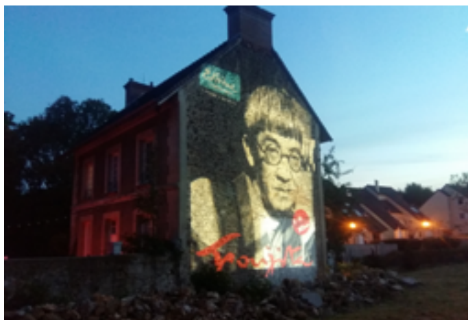
Maison-atelier Foujita

www.mediatheques.boulognebillancourt.com