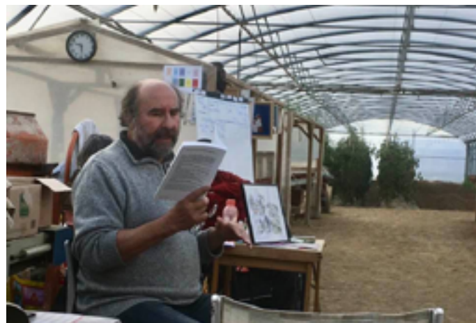
Médiathèque de Châteaudun