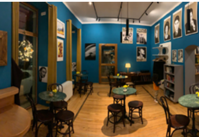
Café Carnus

Jeudi 22 janvier à 18h 1 rue du commandant Djaber 13000 Tlemcen https://www.if-algerie.com/tlemcen