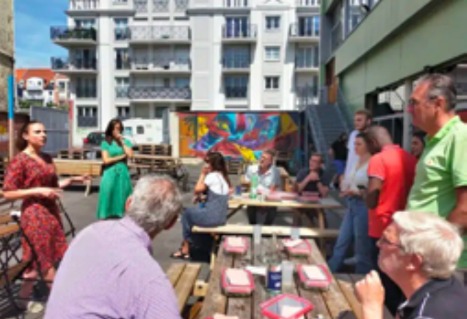
Tiers-Lieu Habitat et Humanisme Menton

Vendredi 23 janvier, marathon lecture à 9h et atelier d'écriture à 14h (réservé au public interne de la structure) Impasse du Petit Rochefort 38760 Varcès-Allières-et-Risset