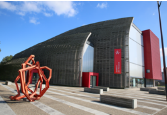
Théâtre de l'Arsenal

Vendredi 23 janvier à 18h, sur inscription au 05 55 25 38 22 ou à mediatheque@meyssac.fr Place de la Poste 19500 Meyssac www.meyssac.bibli.fr