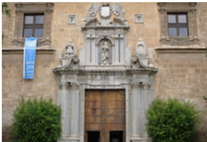
Université de Grenade

Vendredi 23 janvier de 19h à 21h Av. del Hospicio, s/n 18071 Granada https://www.alianzafrancesagranada.org