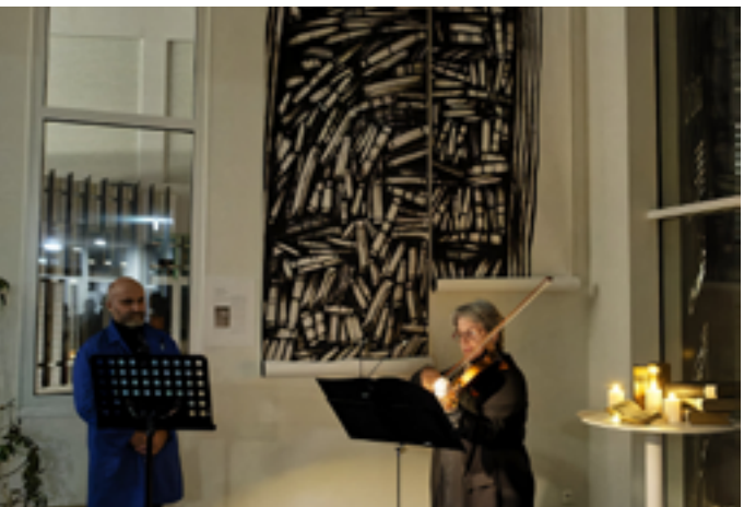
Archives départementales du Puy-de-Dôme © Gilles Sabatier

Samedi 24 janvier de 17h à 18h : « Les Archives d'un coup de crayon ! Avec l'artiste-illustrateur Denis Poughon », de 18h30 à 20h : déambulation nocturne musicale, avec la participation de l'orchestre à cordes de l'école de musique de Vic-le-Comte, sur inscription par téléphone au 04 73 23 45 80 75 rue de Neyrat 63100 Clermont-Ferrand www.archivesdepartementales.puy-de-dome.fr