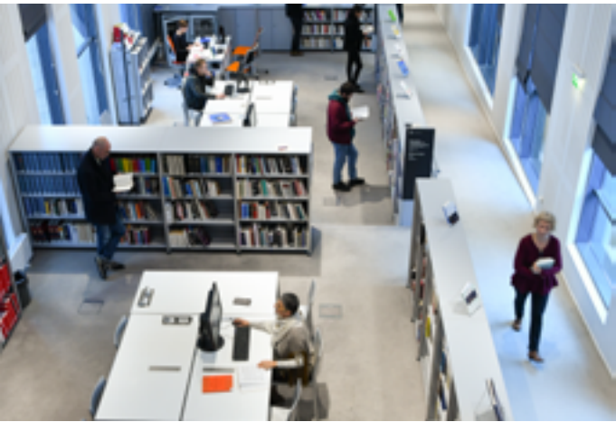
Philharmonie de Paris

Vendredi 23 janvier de 18h15 à 19h15 : atelier « B(D)ruitage » sur inscription ici , de 19h30 à 20h : lecture musicale sur inscription ici , de 20h15 à 21h15 : initiation au beatbox , sur inscription ici Samedi 24 janvier de 18h à 19h30 : atelier « chœur d'un jour » sur inscription ici , de 19h45 à 20h15 : lecture musicale sur inscription ici 221 avenue Jean Jaurès 75019 Paris www.philharmoniedeparis.fr