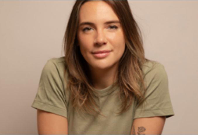
L'Escale Médiathèque - Lumir Lapray

Vendredi 23 janvier à 18h : visite guidée de l'exposition Samedi 24 janvier de 14h à 17h : projection de la cinémathèque de Nouvelle-Aquitaine à 18h30 : spectacle « Broussaille » 8 avenue Fayolle 23000 Guéret www.bm-grandgueret.fr