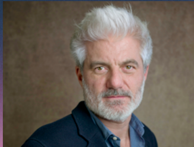
Laurent Gaudé

Né en 1972, Laurent Gaudé a fait des études de Lettres Modernes et d'Études Théâtrales à Paris. Après des années consacrées à l'écriture théâtrale, il publie en 2001 chez Actes Sud son premier roman Cris , sur les atrocités de la Première Guerre mondiale. Avec La mort du roi Tsongor , il obtient, en 2002, le Prix Goncourt des Lycéens et le Prix des Libraires. En 2004, il est lauréat du Prix Goncourt pour Le soleil des Scorta , un roman qui se déroule dans les Pouilles en Italie, sa terre d'adoption. Reconnu pour son écriture au souffle épique, son style lyrique et sa capacité à explorer des thèmes universels avec empathie et humanité, ses œuvres interrogent notre rapport à l'amour, la fidélité, le deuil, l'exil, la mémoire et la vengeance tout en laissant place à l'espoir et à la beauté de la vie. Ses oeuvres sont régulièrement prescrites dans les classes de collège et de lycée et rencontrent un grand succès auprès des enseignants.