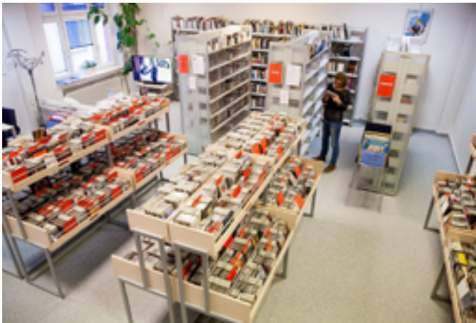
Institut français de Prague © I DR

Mercredi 21 janvier à 18h Štěpánská 644/35 110 00 Prague https://www.ifp.cz/fr/evenements/event4636-nuits-de-la-lecture-soiree-lecture-a-voix-haute-sur-le-thme-villes-et-campagnes#/