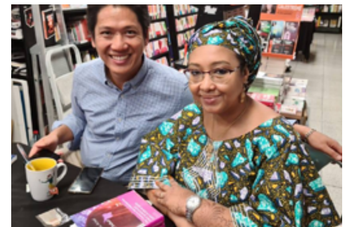
Librairie Autrement

Vendredi 23 janvier, réservé aux publics internes à la structure Rue Boueni Foundi 97600 Koungou www.clg-boueni.ac-mayotte.fr