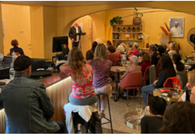
Théâtre national de Nice

Jeudi 22 janvier à 19h 4 place Saint-François 06300 Nice www.tnn.fr