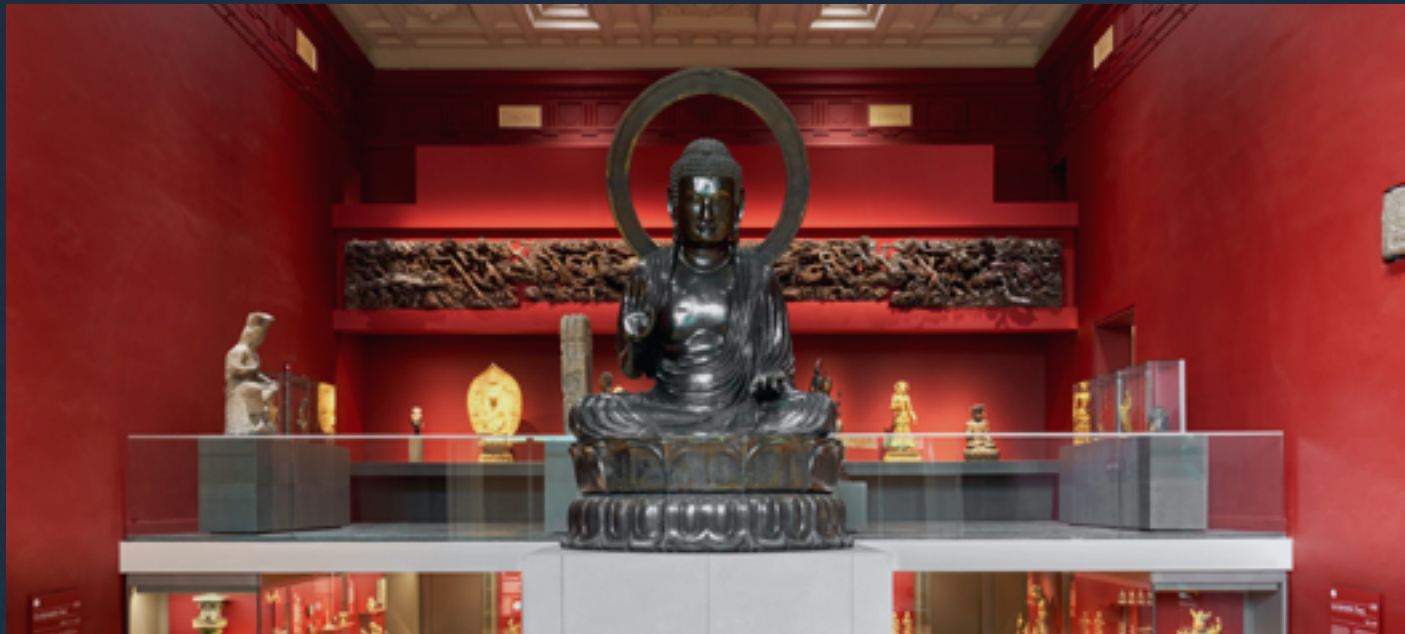
Musée Cernuschi © Pierre Antoine