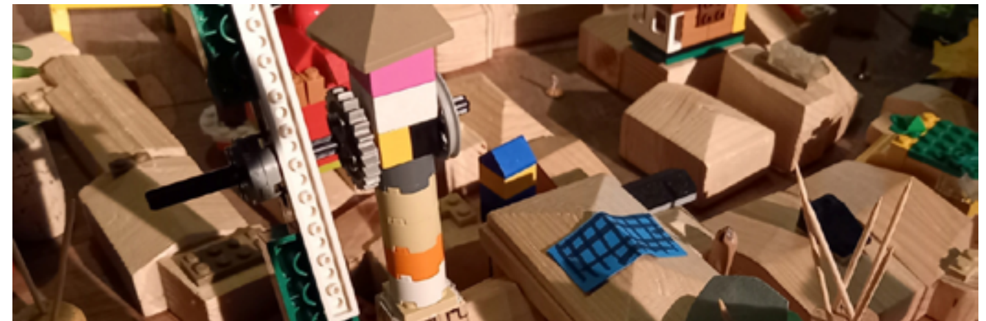
Cité des Sciences et de l'industrie