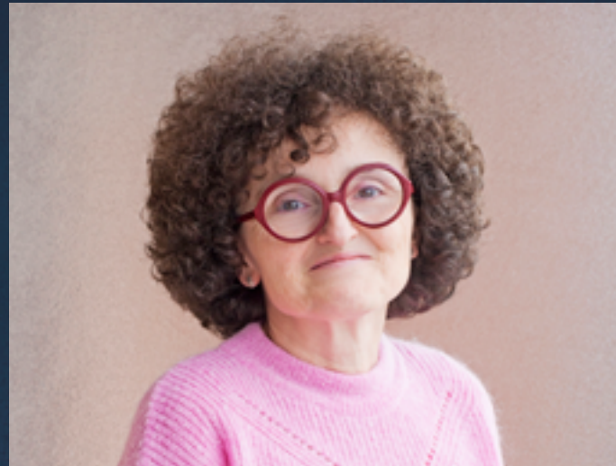
Marie-Hélène Lafon

Née à Aurillac dans une famille de paysans, Marie-Hélène Lafon vit et travaille à Paris. Agrégée de grammaire et docteur ès lettres, elle a enseigné les lettres classiques de 1984 à 2025 et a commencé à écrire en 1996. Ses romans et nouvelles, publiés depuis 2001 chez Buchet Chastel, évoquent la vie rurale avec une grande singularité, mais sont aussi traversés par les solitudes urbaines, les silences des familles et la vaillance ordinaire des invisibles. Le Goncourt de la nouvelle lui est décerné en 2016 pour son ouvrage Histoires et le prix Renaudot en 2020 pour Histoire du fils . Elle travaille aussi avec des photographes et a écrit des variations libres sur Flaubert ou Cézanne.