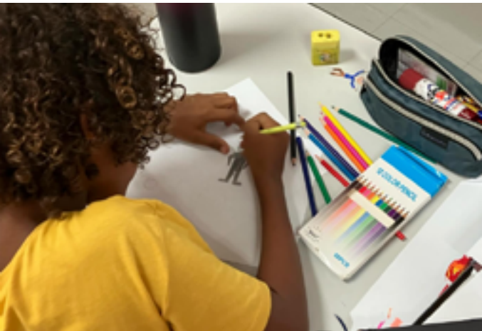
Lycée français de Lusaka

Mercredi 21 janvier de 17h30 à 19h30, réservé à un public scolaire Plot 22725 Alick Nkhata Rd, Lusaka 10101, Zambie