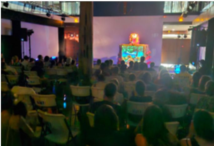
Théâtre de l'Entonnoir