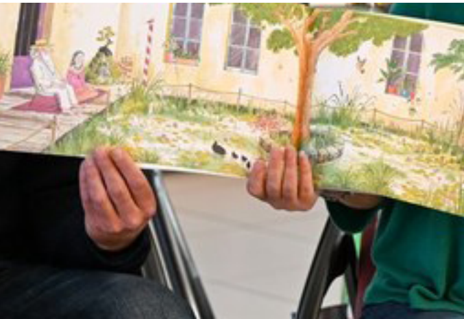
Médiathèque Jean-Louis Curtis - Éditions Poids-Plume