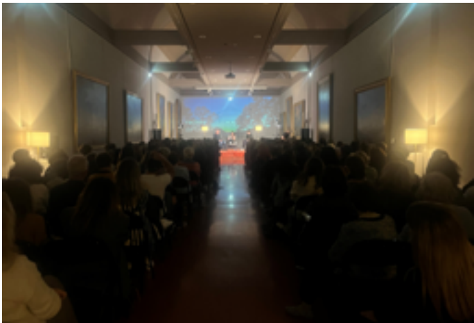
Palais Fesch

Le Palais Fesch, musée des Beaux-Arts d'Ajaccio, a été construit au XIX e siècle, suite à la demande du cardinal Fesch, oncle de Napoléon 1 er , dans le but de créer un « Institut des Arts et des Sciences ». Ce grand collectionneur d'art légua à sa ville natale environ 1 500 tableaux, meubles, objets d'art et ornements liturgiques. Différents dons et legs ont enrichi ces collections au fil des siècles.