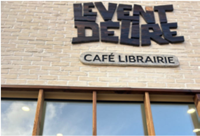
Librairie Le Vent délire

Samedi 24 janvier à 19h 17 place Yan du Gouf 40130 Capbreton