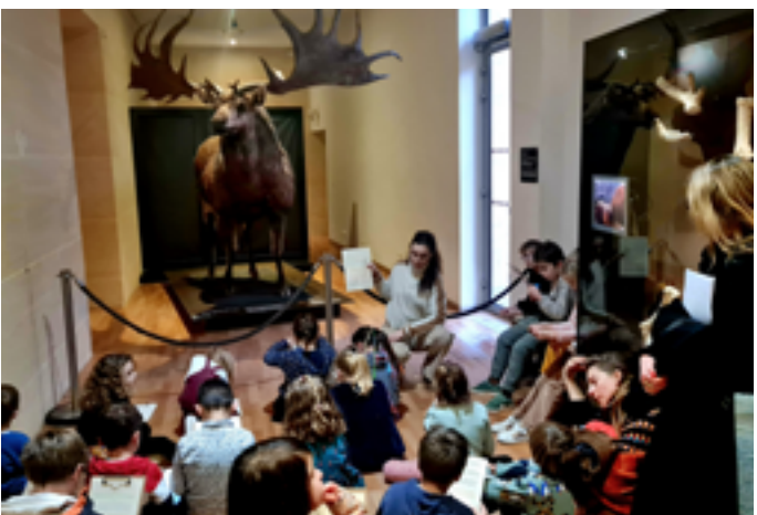
Musée national de Préhistoire