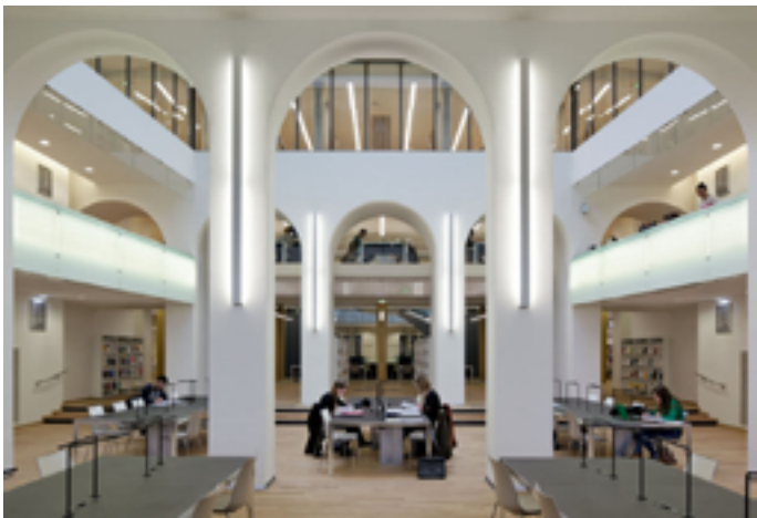
Bibliothèque nationale et universitaire

Vendredi 23 janvier à 18h30 Auditorium de la Bibliothèque nationale et universitaire 6 place de la République 67000 Strasbourg