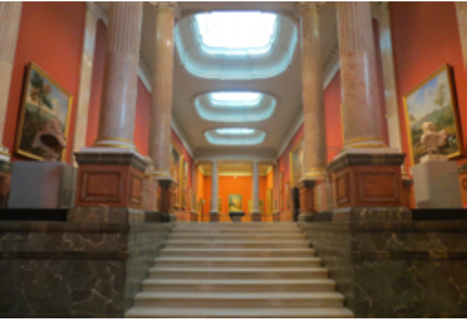
Musée Fabre - Galerie des Colonnes

Samedi 24 janvier à 9h45 et 10h30 : visite pour les tout-petits, sur inscription au 04 99 06 27 34 Samedi 24 et dimanche 25 janvier de 11h à 17h : dispositif « Histoires en balade » (compris dans le prix d'entrée), à 15h : spectacle « Chefs d'œuvre » (payant) 39 boulevard Bonne-Nouvelle 34000 Montpellier www.museefabre.fr