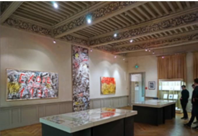
Maison des mémoires Carcassonne

Mercredi 21 janvier à 10h30 : tapis de lecture « rat des villes et rat des champs » dès 4 ans, à 16h : rencontre-dédicace avec Georges-Patrick Gleize Jeudi 22 janvier à 18h30 : spectacle par la compagnie l'Arbassonge Vendredi 23 janvier à 16h : lectures « flâneries urbaines » par Anna K Samedi 24 janvier à 14h30 : dictée géante, à 16h : « mirequiz » 14 rue Vidal Lablache 09500 Mirepoix