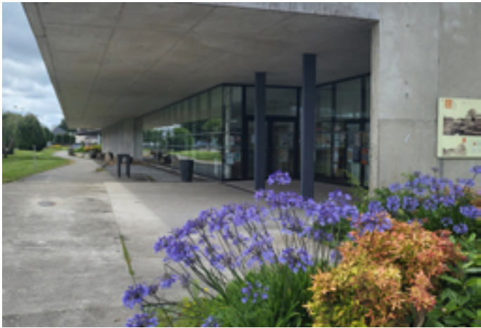
Médiathèque de Locminé

Pour les 10 e Nuits de la lecture, la médiathèque de Locminé invitera le public à plonger dans la littérature policière, avec une adaptation théâtrale et musicale de nouvelles écrites par les maîtres du polar français tels Brigitte Aubert, Jean-Hugues Oppel, Jean-Claude Izzo ou encore Didier Daeninckx. Entre le cabaret, le conte et le théâtre, ce spectacle emmène le public dans les coulisses