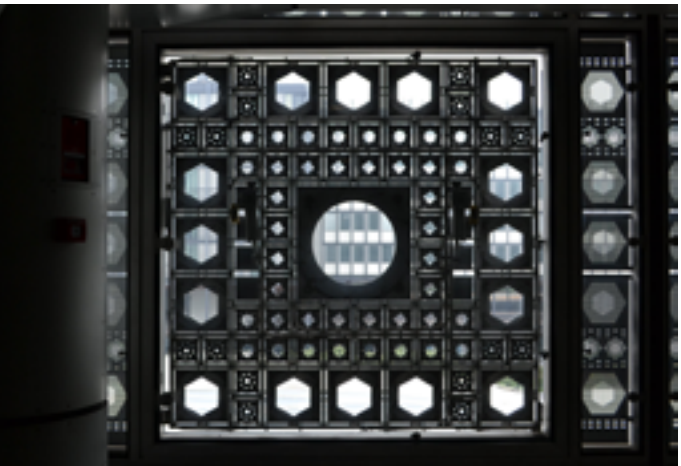
Institut du Monde Arabe

Dimanche 25 janvier à 17h 1 rue des Fossés Saint-Bernard 75005 Paris www.imarabe.org