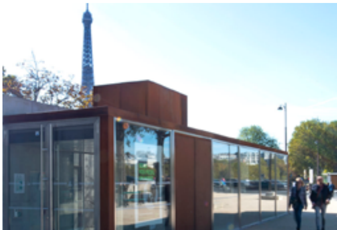
Musée des égouts de Paris