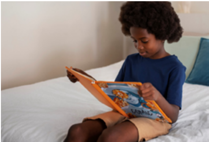
Médiathèque municipale de Merdrignac

Mercredi 21 janvier, atelier bande-dessinée jeune public à 14h30