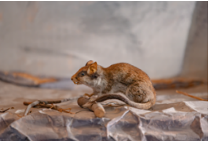
Lérot naturalisé au Musée d'histoire naturelle et d'ethnologie

Vendredi 23 janvier de 17h30 à 18h30 : déambulation au flambeau, sur inscription au 03 21 71 62 91, de 18h45 à 19h45 : collation conviviale, à 20h : scène ouverte 20 rue Paul Doumer 62000 Arras