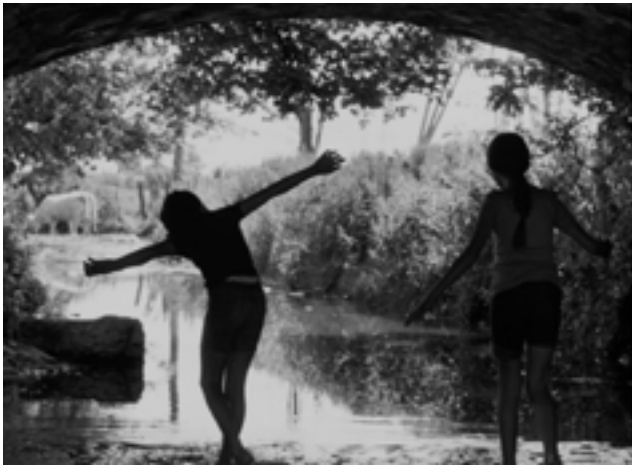
Librairie du Vol dans les Plumes - Aqua de Gaspard Koenig