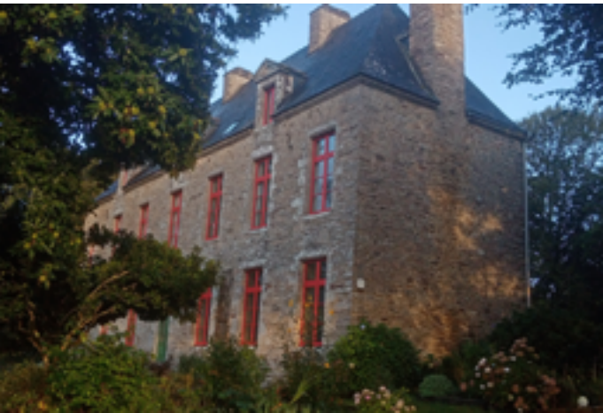
Abbaye de Landeveaux

Samedi 24 janvier, spectacle « Papiers Graines (& Pépiements) » (participation libre) à 17h30 Dimanche 25 janvier, spectacle « Les Cris de Tatibagan » (participation libre) à 17h30 Sur inscription au 06 07 10 62 23 ou à lesheuresdelanvaux@abbayedelanvaux.fr 150 Abbaye de Lanvaux 56390 Brandivy www.abbayedelanvaux.fr