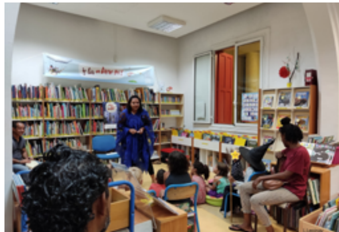
Médiathèque la Montagne

Ils seront ensuite lus « à la criée » par les participants auprès du public de la bibliothèque. Un