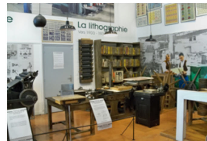
Musée de l'imprimerie et du cartonnage de Valréas