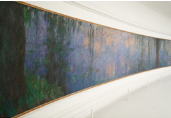
Les Nymphéas, Claude Monet

Mercredi 21 janvier, BD-concert « Le voleur de Poule » à 16h Jeudi 22 janvier, projection-rencontre du documentaire Premières Lunes à 9h, sur inscription ici Samedi 24 janvier, activités jeune public autour du livre Carabistouilles de légumes péi à 14h (sur inscription ici ), ciné-concert « Mon île » à 18h 16 rue V. le Vigoureux 97430 Le Tampon www.mediatheque-tampon.fr