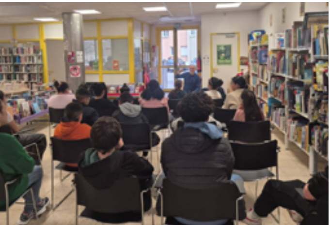
Médiathèque des Cannes

Jeudi 22 janvier à 16h30, sur inscription au 04 95 56 25 27 ou à bibliotheque@ghisonaccia.corsica Rue Saint-Michel 20240 Ghisonaccia