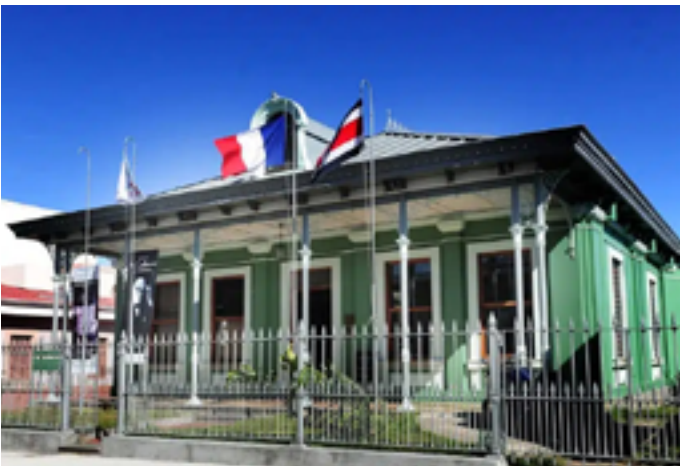
Alliance française Costa Rica – San José