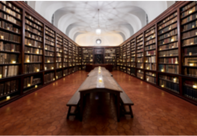
Centre Culturel Irlandais

Mercredi 21 janvier à 19h 11 rue de Constantinople 75008 Paris www.hotelslitteraires.fr