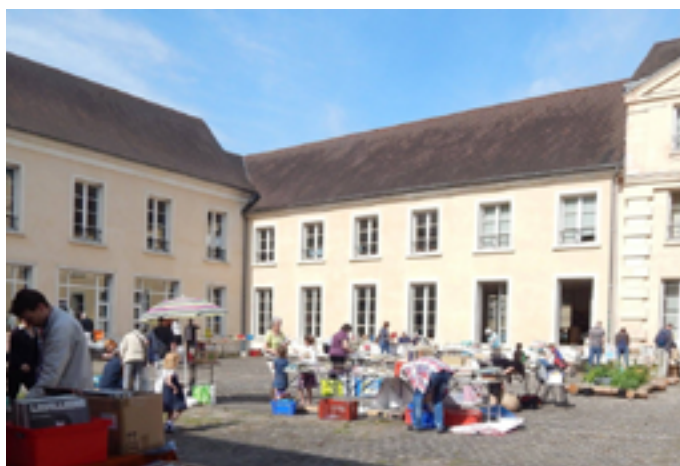
Médiathèque Jean Macé © DR

Vendredi 23 janvier, soirée pyjama à 19h, sur inscription au 03 81 87 82 40