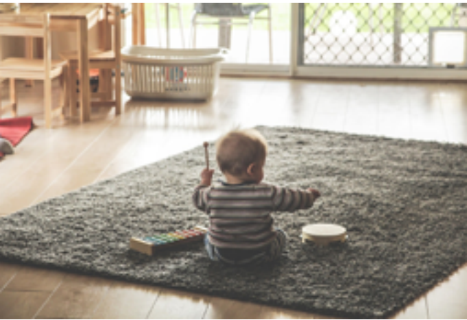
Découverte musicale à la médiathèque du Bachut

Mercredi 21 janvier, atelier jeune public sur l'application Storyplay'r à 16h30 Jeudi 22 janvier, rencontre avec Véronique Chauvy à 17h Samedi 24 janvier, atelier-jeu d'écriture jeune public à 16h et spectacle à 18h Sur inscription au 04 43 76 27 62 Parc de la Mairie 63370 Lempdes www.bibliotheques-clermontmetropole.eu