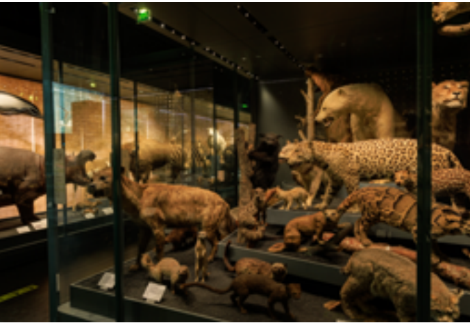
Muséum de Toulouse

Samedi 24 janvier à 14h30 13 rue Sainte-Ursule 31000 Toulouse www.asso-toulousejapon.org