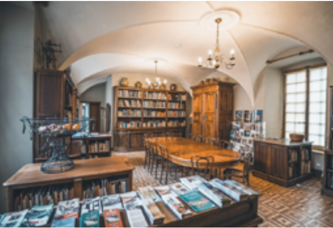
Musée de l’imprimerie © DR

Samedi 24 janvier, rencontre d’auteurs et dedicaces, centre de documentation nomade, atelier d’impression, atelier « Boîte à histoires bressanes », atelier typographique, lectures et partage de coups de cœur à 14h ; contes et atelier d’écriture à 16h ; atelier « Marque ta page ! » à 18h Entrée libre à partir de 1 € 29 rue des Dodanes 71500 Louhans www.ecomusee-bresse71.fr