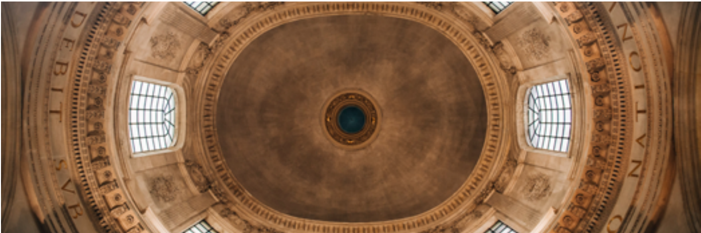
Institut de France