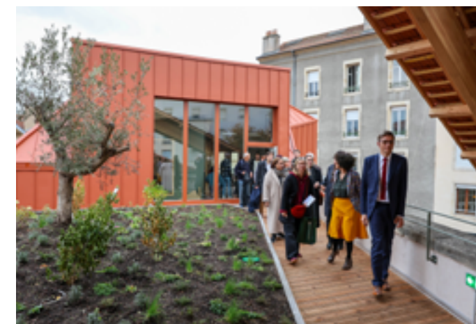
Maison des femmes

Mercredi 21 et jeudi 22 janvier, réservé à un public scolaire Programmation complète sur le site des Nuits de la lecture 2 place du Collège 57190 Florange