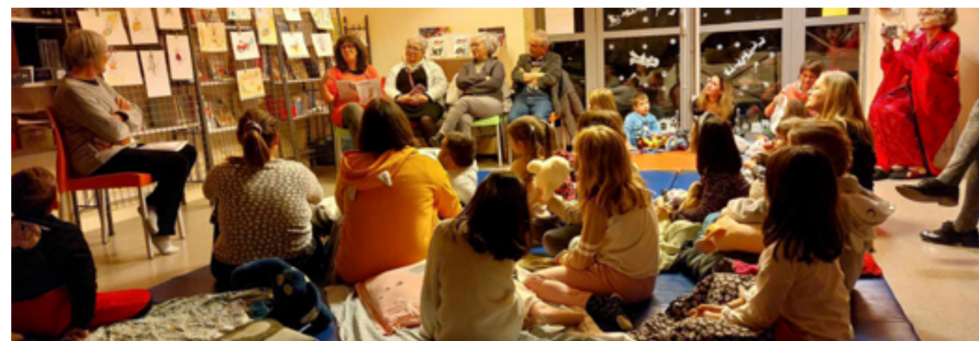
Bibliothèque d'Agris

Aujourd'hui les questions de transition écologique viennent redéfinir cette relation entre villes et campagnes. Intimement liés, ces deux espaces géographiques se répondent malgré des représentations qui ont la vie dure. Nature, habitats, mobilité, proximité, identité et organisation politique, aménagement du territoire, inégalités territoriales, les auteurs et autrices contemporains se font l'écho de ces préoccupations.