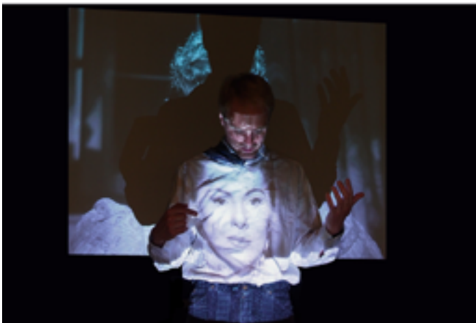
« L'Homme d'à côté » à la Cinémathèque © Vincent Rouche et Lucie Quintaine

Samedi 24 janvier à 19h 51 rue de Bercy 75012 Paris www.cinematheque.fr