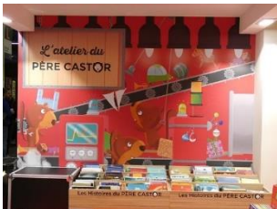
Maison du Père Castor