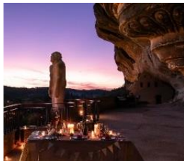
Musée national de Préhistoire © DR