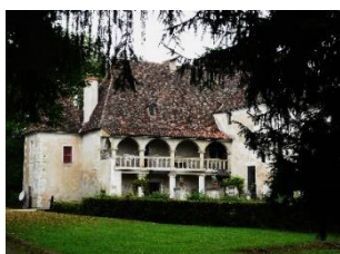
Château de Saint-Germain-du-Salembre

Samedi 25 janvier, « Enquête au cœur de musée » à 17h et « Paléophonies » à partir de 17h30, sur inscription 1 rue du Musée 24620 Les Eyzies musee-prehistoire-eyzies.fr