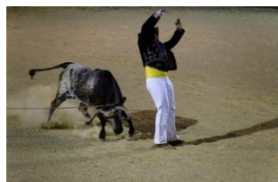
Course landaise