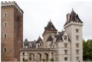
Château de Pau