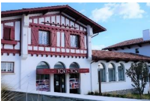
Bibliothèque Toki-toki